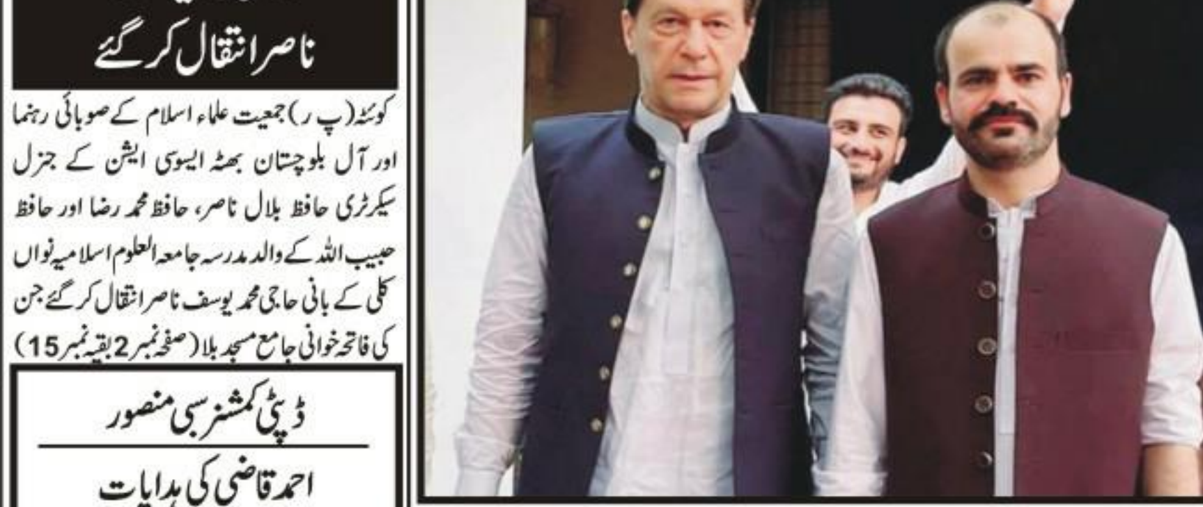
بلوچستان میں سیاسی جموں کو توڑ کر عام سیاسی کارکن کو سیاست میں اہم کردار ادا کرنے کا موقع پیش پارٹی ہی فراہم کرتا ہے۔ انہوں نے کہا کہ انہوں نے کوئٹہ میں موجود سیاسی جماعتوں کے ساتھ مل کر کام کیا ہے، انہوں نے کہا کہ انہوں نے کوئٹہ میں موجود سیاسی جماعتوں کے ساتھ مل کر کام کیا ہے...