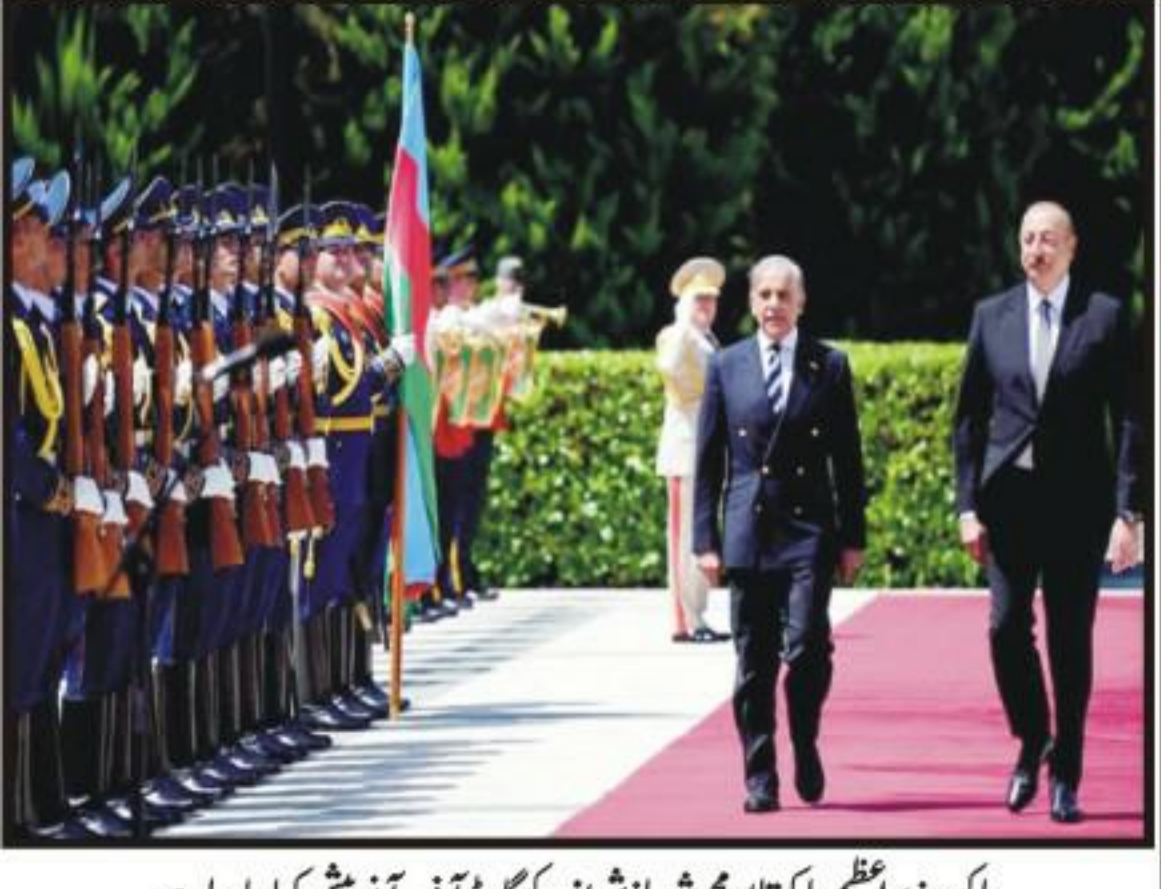
باکو، وزیر اعظم پاکستان محمد شہباز شریف کو کارڈ آف آنرز پیش کیا جا رہا ہے

وزیر خزانہ آئی ایم ایف پر برس پڑے، سٹیٹ بینک تراہیم واپس لینے کا عندیہ، آئی ایم ایف اعتراضات، ہمیں کچھ تو اپنی مرضی کی اجازت ہونی چاہیے