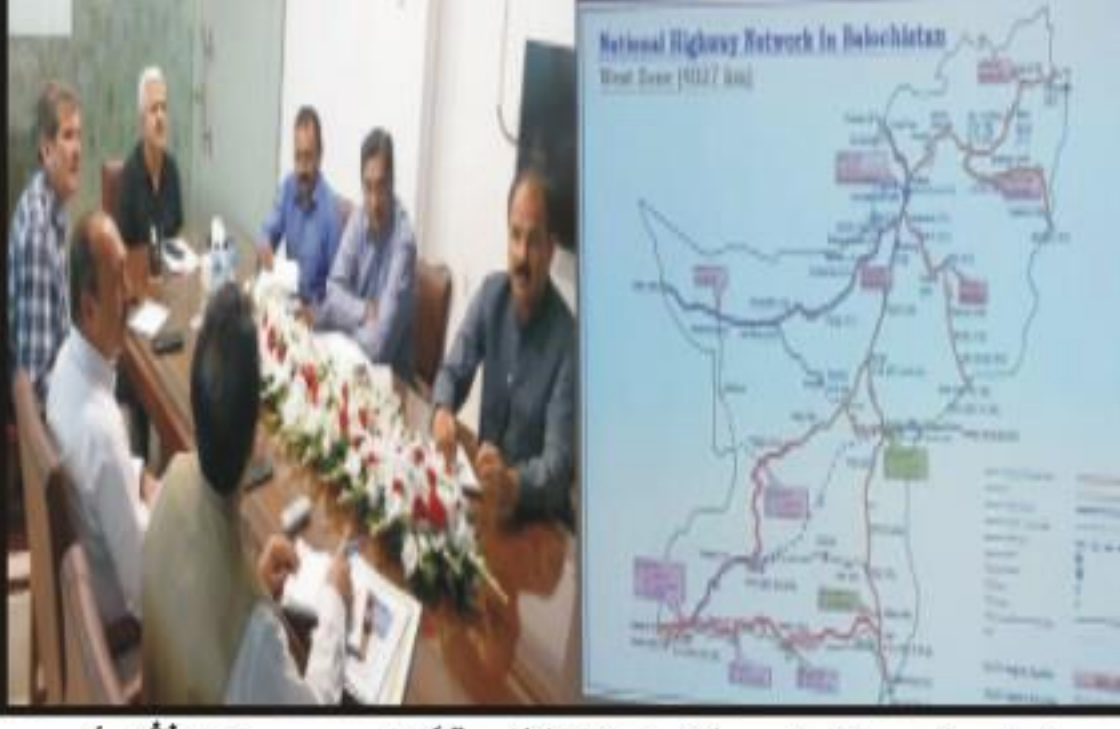
سندری طوفان کے باعث قومی شہر اہل بلوچستان کو خطرہ ہے۔ چٹون افغان نرسنگ میں داخل ہونے کا خطرہ ہمدردی اور وفاقی وزیر مواصلات و پٹرول سروسز ایم ڈی شریف نے پارٹی میں داخل ہونے کا خطرہ...