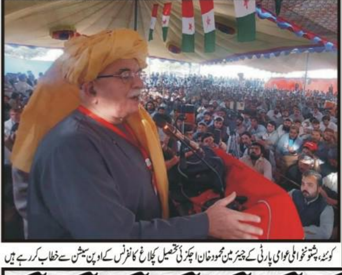
کونسل، چوٹی کی ٹی وی پارٹی کے چیئرمن جومندان پھریل قسطنطنیہ کلاؤ کافرٹس کے ایجنٹس سے خطاب کر رہے ہیں

پاک، یورپی یونین کا پارلیمانی تعاون بڑھانے پر اتفاق جنونی ایشیا میں استحکام عالمی امن کے لیے ناگزیر ہے، وزیر مملکت