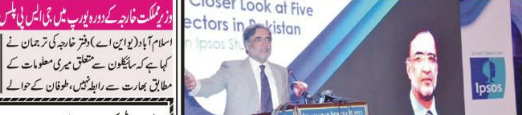
اسلام آباد، وزیر اعظم کے معاون خصوصی قمر زمان کائرہ منصفہ تقریب سے خطاب کر رہے ہیں

تھار بانی کھر کی یورپی یونین کے عہدیداران سے ملاقاتیں پاکستان اور یورپی یونین کا پارلیمانی تعاون بڑھانے پر اتفاق