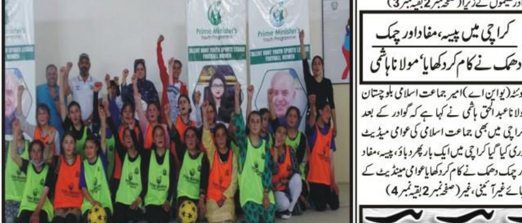
وزیر اعظم ہمت خواتین فٹ بال چیمپئنز ٹرافی میں شریکیت کے لئے بلوچستان کو بلائیے۔ انہوں نے کہا کہ انہوں نے کوئٹہ میں موجود سیاسی جماعتوں کے ساتھ مل کر کام کیا ہے، انہوں نے کہا کہ انہوں نے کوئٹہ میں موجود سیاسی جماعتوں کے ساتھ مل کر کام کیا ہے...